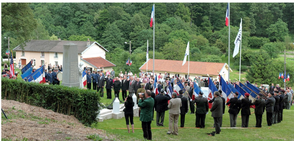
Cérémonie de 2012 à Vauquois