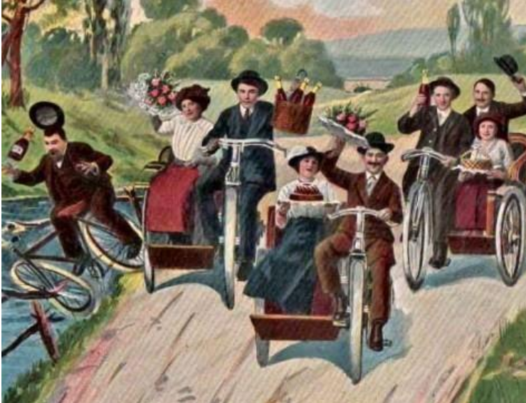
▲ Le modèle d'origine et l'un de ses descendants ! ▶