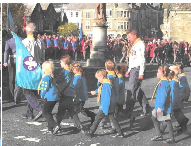
Les « enfants des écoles »