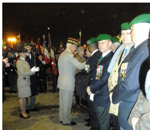
Les nombreux drapeaux présents et le salut du général Dary aux participants