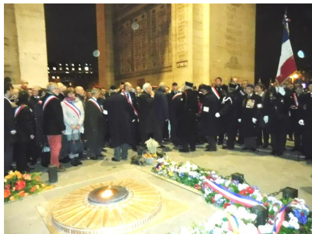
Les porte-drapeau réunis avant la cérémonie, puis les élus devant la Flamme