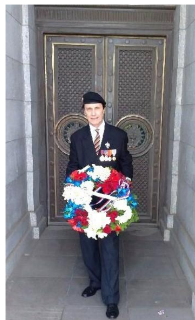
La cérémonie de Sydney et notre Ancien portant la couronne des Anciens Combattants français de l'état de Victoria