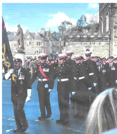
Les Forces et les Anciens