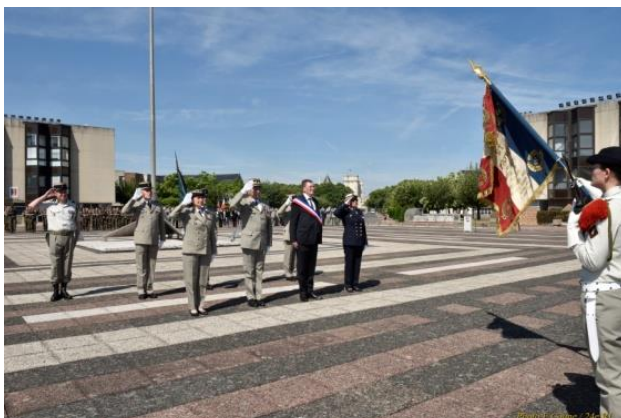
Le salut au Drapeau par les officiels