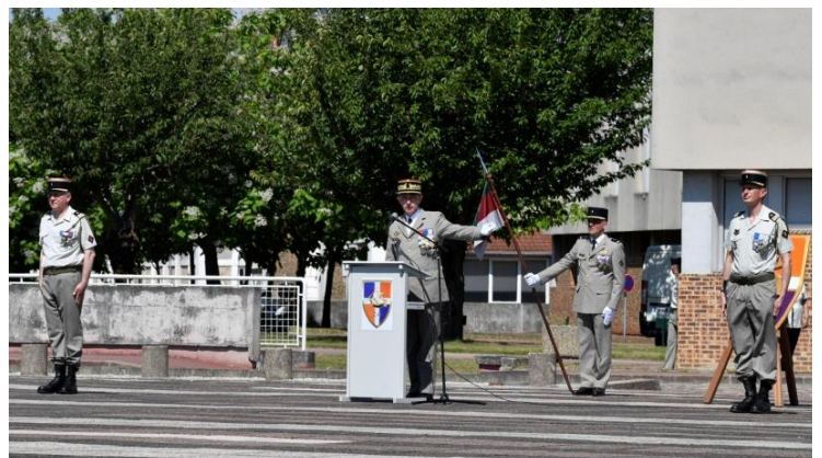
La passation de commandement