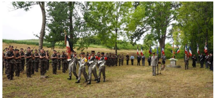
Le dispositif sur les bords de l'Aisne