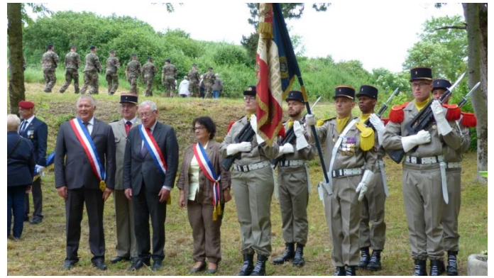
▲ Les drapeaux des Amicales des 5ème, 46ème et 24ème R.I.