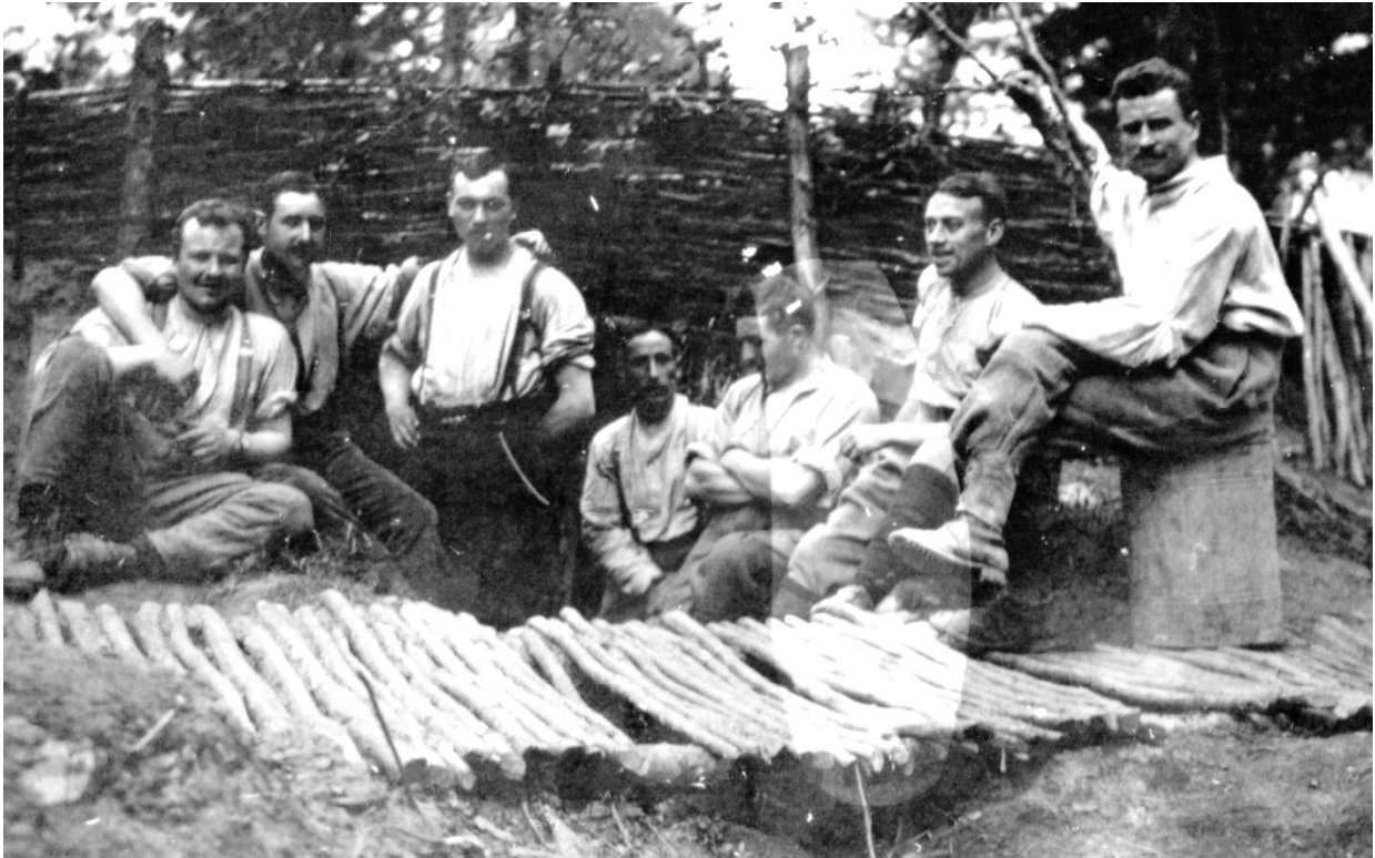
1916 : musiciens du 46 au repos