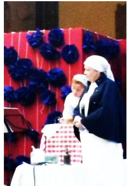
Le spectacle historique dans les salons de la mairie, la pose du groupe et la « pause dinatoire »