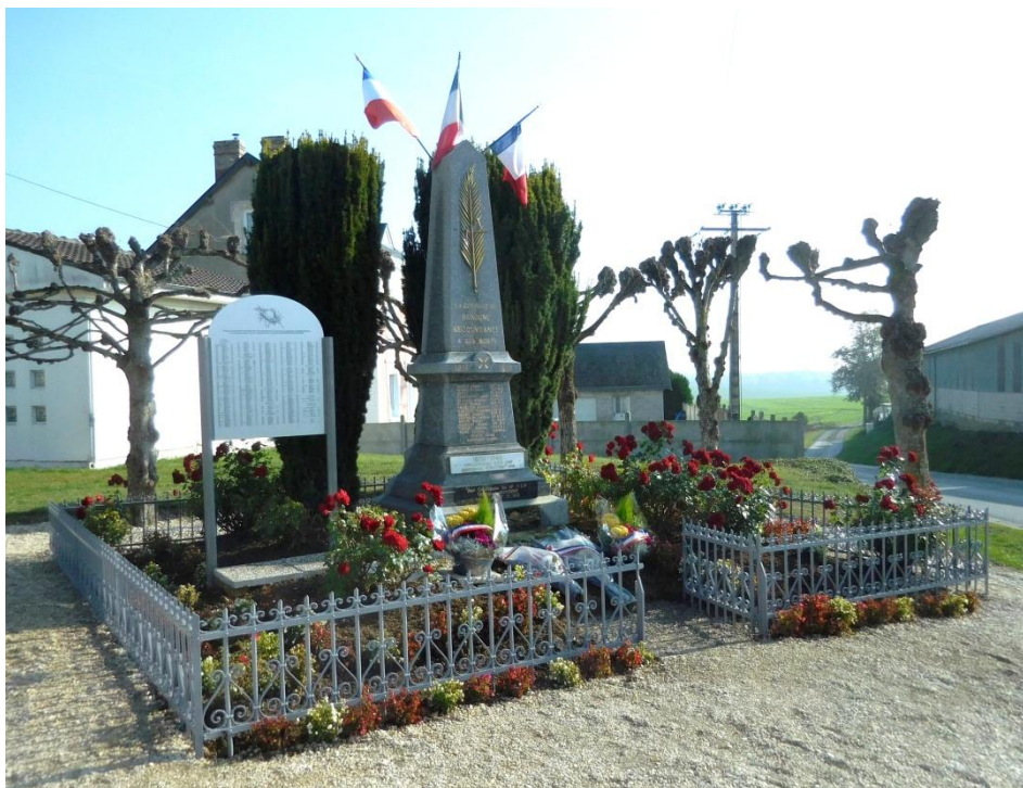
La stèle, le monument aux Morts et le panneau portant les noms des combattants tombés sur le territoire de la commune