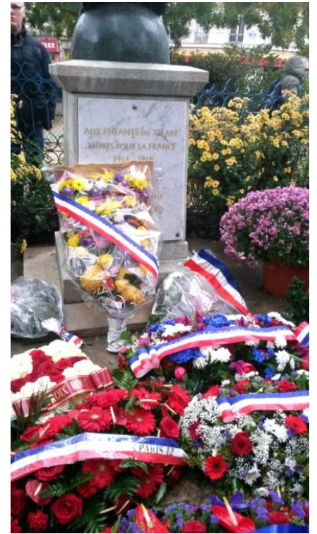
Le dépôt de gerbe au monument aux Morts du XIIème