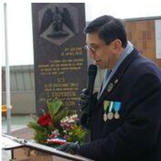
Le président du 5ème pendant son allocution

◀ L'accueil des Cendres, le 15 décembre 1840