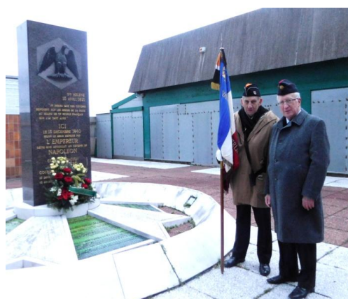
La délégation du 46ème, peu nombreuse mais de qualité !