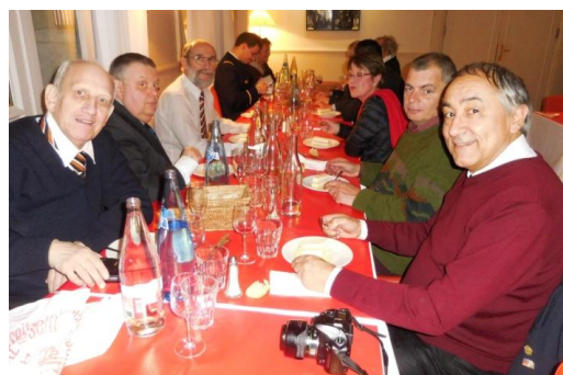
Après le vent glacial du quartier de la Défense, un peu de réconfort au Cercle des Armées !