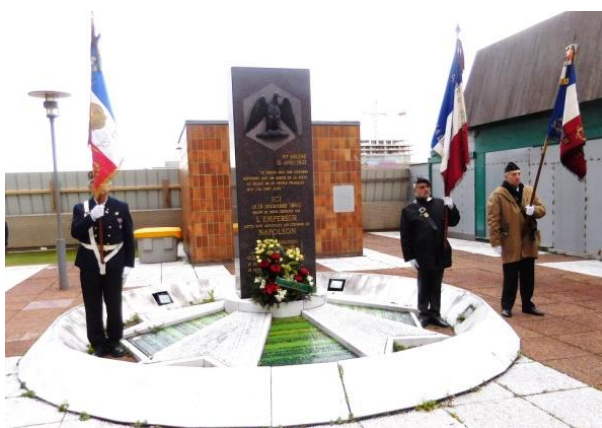
Les drapeaux des 5ème et 46ème encadrant celui du Comité local de la Légion d'Honneur