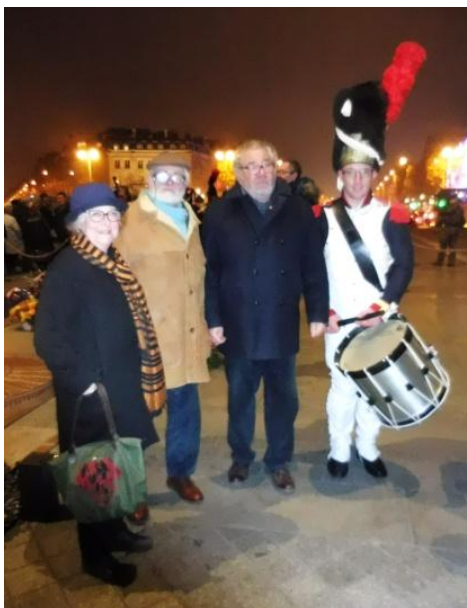
Trois Anciens et un tambour