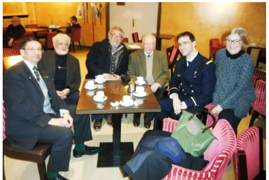
5ème et 46ème réunis au Cercle des Armées