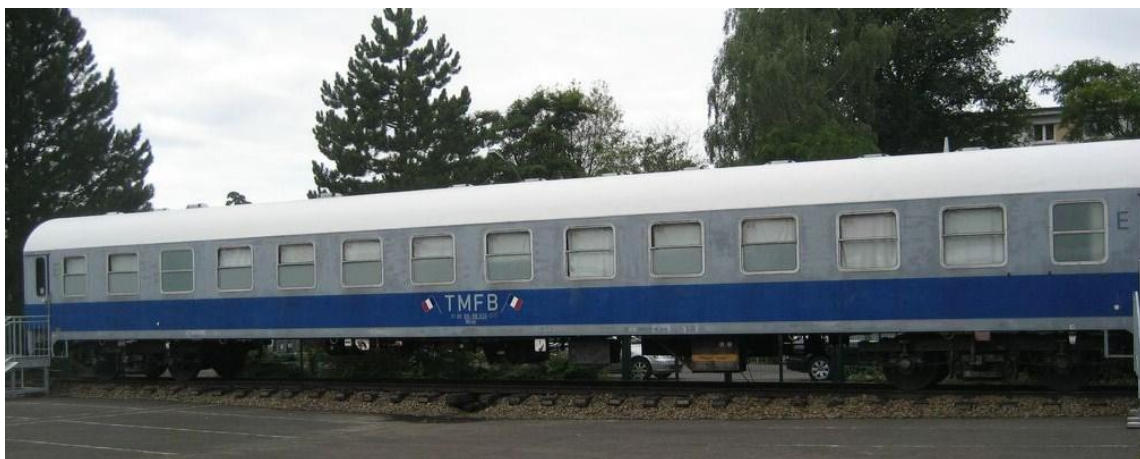
Le wagon du Train Militaire Français de Berlin conservé au Musée des Alliés