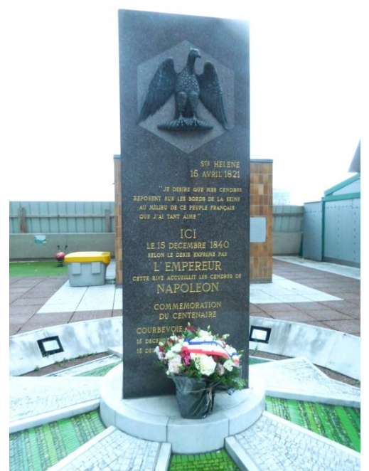
Quelques fleurs au pied de la stèle perdue au milieu des tours de bureaux