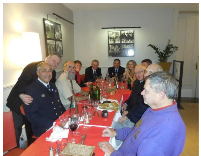
Le président de l'Amicale du 5ème RI pendant son allocution sous la pluie pénétrante et le vent glacial de la Défense, puis les participants pendant le repas réparateur au Cercle des Armées